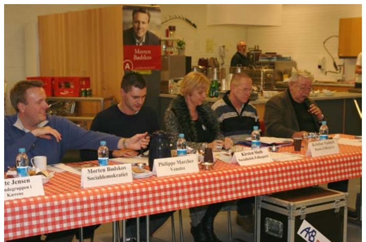
Morten til vælgermøde på Milestedet.