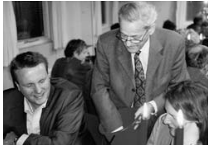
Formanden i fuld gang med at sælge lodsedler.