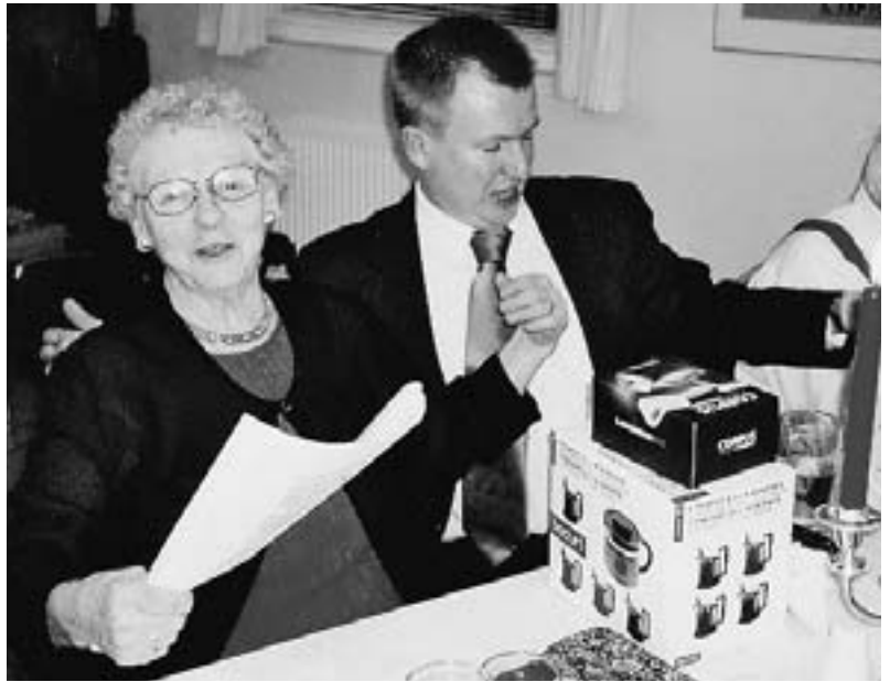
Der blev sunget igennem ved fællessangen.

Her er nogle af Vivi Skrivers fotos fra Nytårskuren.