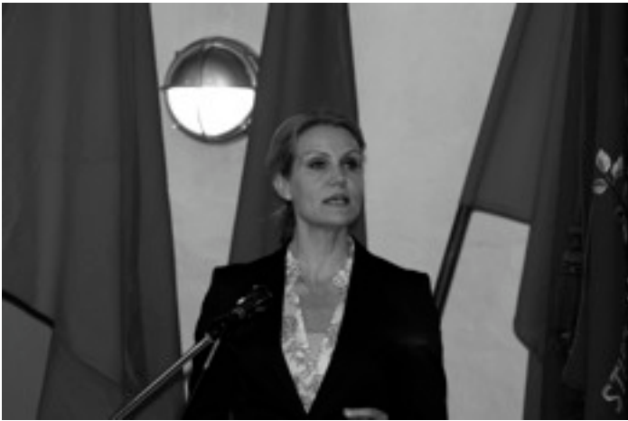
Helle Thorning fik stående bifald for sin 1. maj-tale

arbejde, som er nyttigt for samfundet. Det skal selvfølgelig ikke fortrænge almindelige jobs, men give noget arbejde, der er nyttigt for samfundet og på den måde sikre, at de er tættere på det almindelige arbejdsliv.