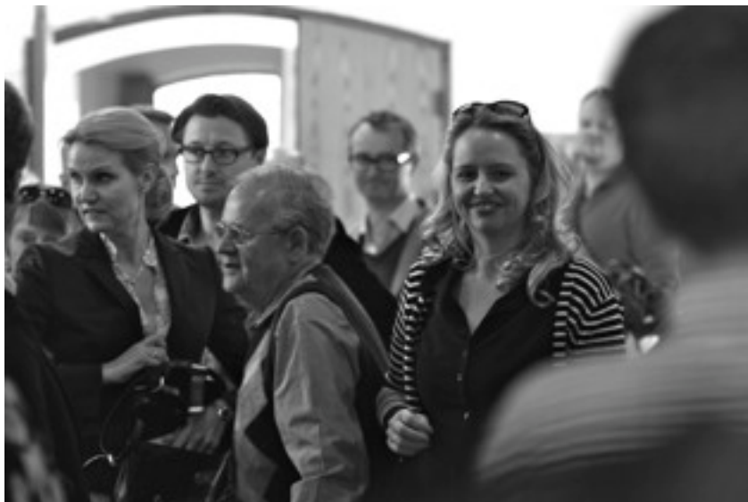
Der var trængsel ved indgangen til Loen, da Helle Thorning kom til Rødovregård

Selvom der blev skaffet mange pladser, var der mange, som måtte stå op. Døren ud til gården blev åbnet, så man også udenfor kunne høre 1. Maj-talerne og underholdningen af "De gode mænd".