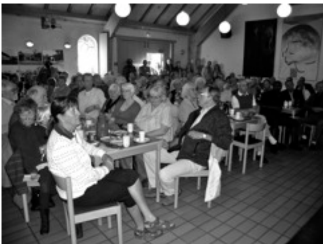
Folk måtte stå op for at få plads til 1. maj-arrangementet i år

Derfor beder Socialdemokraterne alle danskere om at bidrage mere, og have mulighed for at blive længere tid, på arbejdsmarkedet. Samtidig skal flere unge – og flere unge hurtigere – gennem uddannelserne. Alt sammen styrker dansk økonomi og sikrer, at vi kan forny og udvikle velfærden.