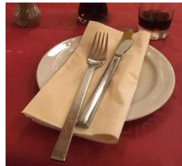
Der var dækket op til fest .