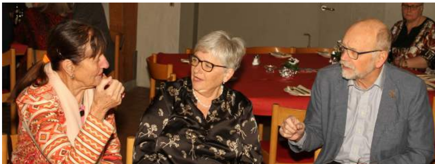
Der var god stemning ved bordene, som var dækket med røde duge.