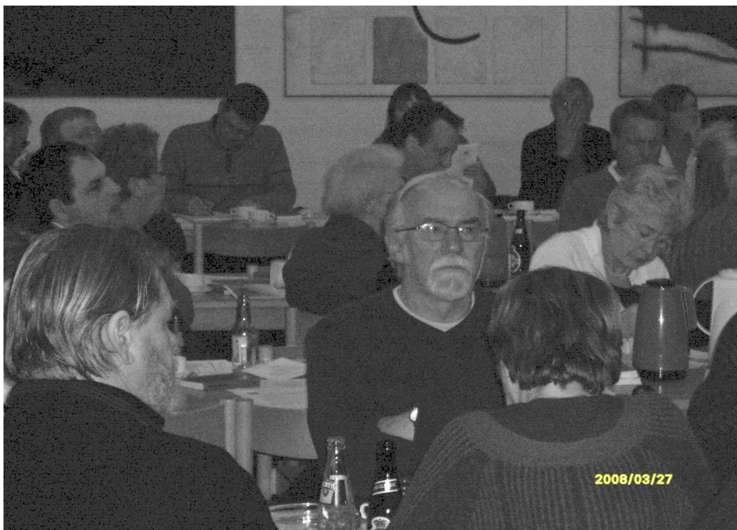
Generalforsamlingen var godt besøgt af partiets medlemmer