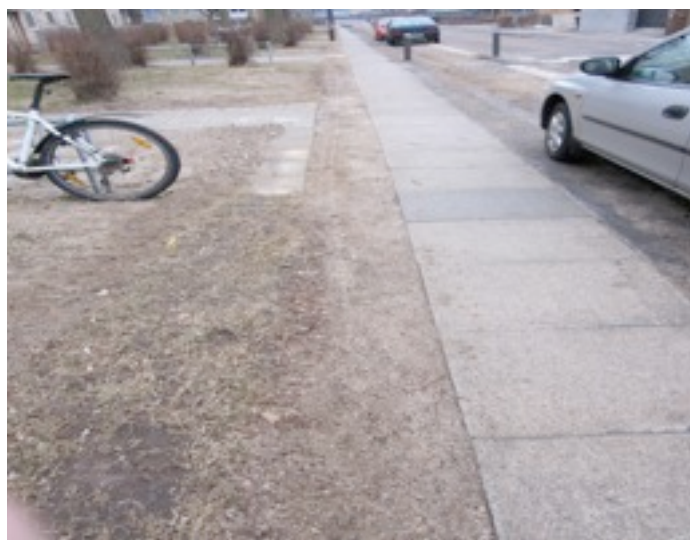
Grusranden efter snefejdning. For ikke at ride bilerne fejes Sne og grus ind på græsplæner og indgangsfliser

Er det her godt nok efter vores partis målsætninger?