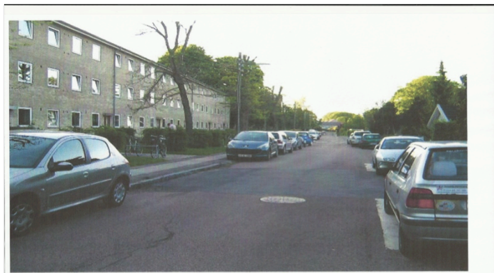
Voldumvej 19-53. Asfalten mellem fortovsfliser og græsplæner er nu Slotsgrus