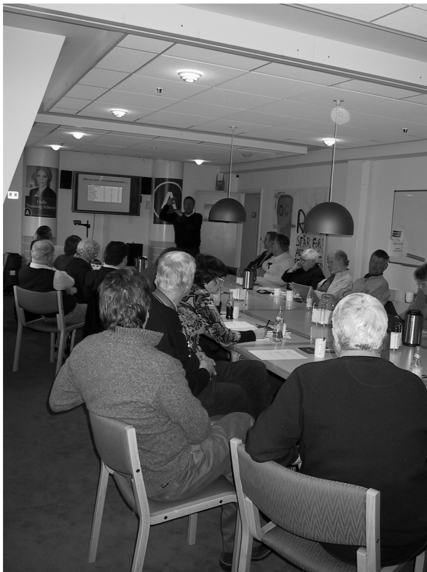
Morten Bødskov orienterer forsamlingen om, at der til næste valg skal gøres en ekstra indsats i Islev. Nederst fortæller storkredsens spidskandidat til EU-valget Claus Larsen-Jensen om sin valgstrategi.

”Alle idéer til at udvikle vores organisation skal frem og vi skal have planlagt en systematiseret og målrettet indsats blandt vores medlemmer, der ikke mindst ved en opsøgende indsats over for Islev-borgerne kan sikre os et ekstra mandat,” lød det fra Morten Bødskov, som ikke mindst i kraft af sin egen aktive indsats i kredsen har været med til at skaffe Socialdemokraterne stor vælgertilslutning på Vestegnen ved de sidste kommunal- og folketingsvalg. -md